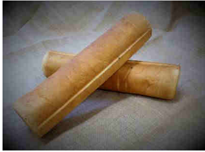
Art. 1800 Fr. 4.60

Toast rond normal 30 cm longueur 7cm de diamètre possible avec la mie de côté