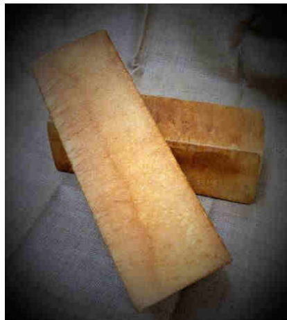
Art. 1804 Fr. 8.60

Carré grand 30 cm longueur 10/10 de côté