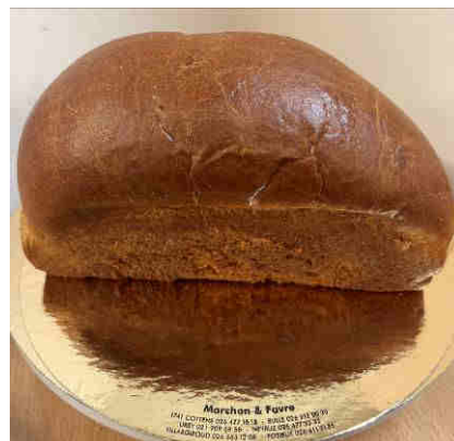
Art. 1719 Fr. 6.50