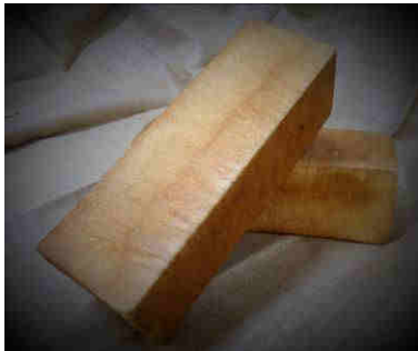
Art. 1801 Fr. 5.60

Toast carré normal 30 cm longueur 7/7cm de côté