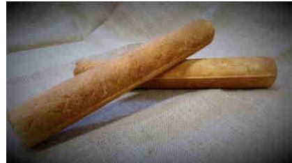
Art. 1802 Fr. 3.60

Toast rond petit 30 cm longueur 4 cm diamètre