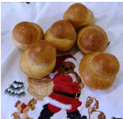
Art. 1718 Fr. 2.50